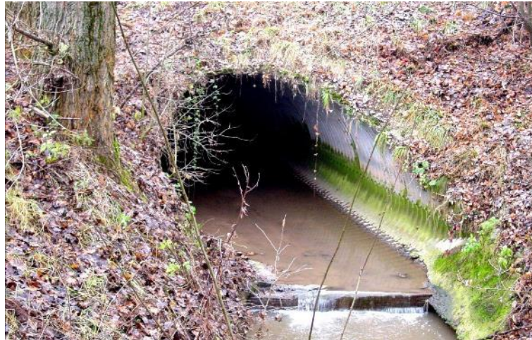
St 2244 Emskirchen – Herzogenaurach, Unterführung des Reichenbachs