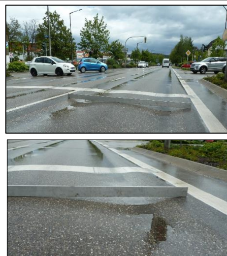
Spurrinnen im Kreuzungsbereich