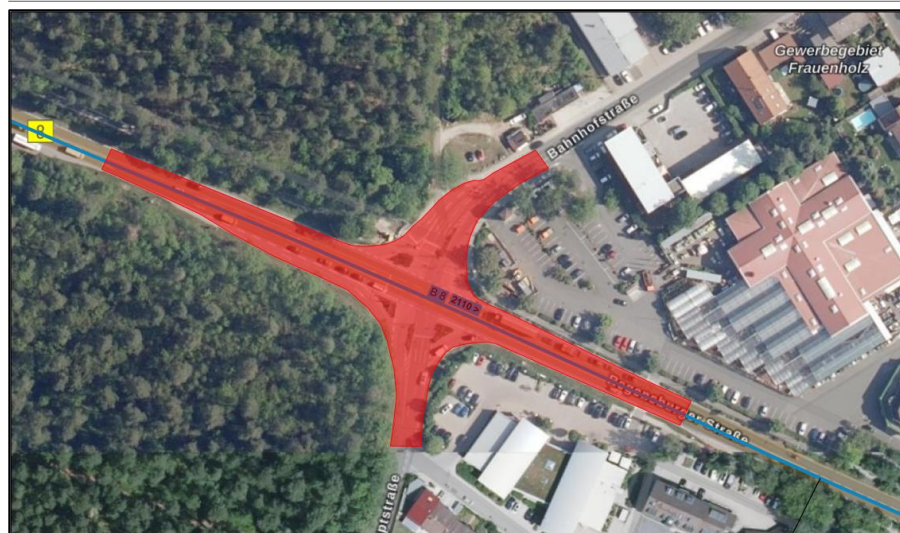
Übersichtslageplan der Maßnahme