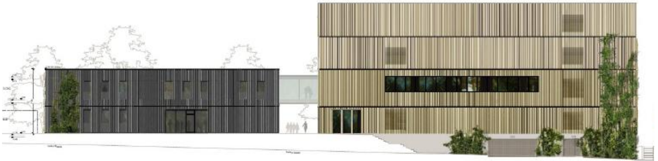
Abb.2: Ansicht Ost Antalyastraße

Durch die Schaffung zwei gestalterisch kontrastierender Baukörper und einer optisch zurückgenommenen Verbindung über einen Steg im 1. Obergeschoss wird das 4-geschossige Hauptgebäude am Nordring als das eigentliche Kulturzentrum wahrgenommen, der 2-geschossige Südflügel mit den untergeordneten Funktionen Restaurant und Wohnen nimmt sich optisch zurück.