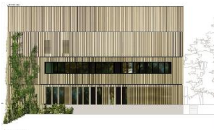
Abb.3: Ansicht Ostring

In der planerischen Umsetzung werden im Neubau folgende unabhängig voneinander funktionierende Nutzungsbereiche geplant: